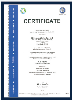
TUV SUD IATF 16949 No.: 12.100.32733 TMS