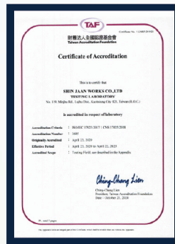
TAF ACCREDITATION ACCREDITATION OF LABORATORY