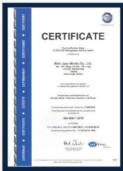
ISO 9001 No.: 12.100.32733 TMS