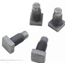
Tボルト/ 四角ボルト