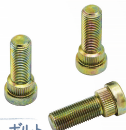
ホイールボルト リップネックネジ