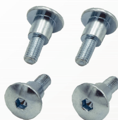
六角穴付きボルト