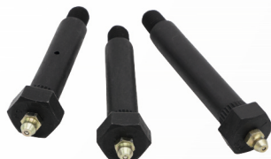
グリースニップル