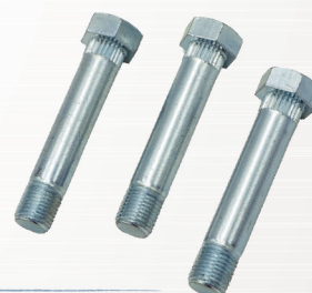
ローレット付きボルト