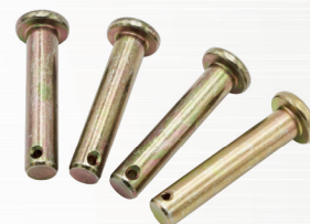
ピン / リベット